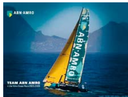
Team ABN AMRO One vandt kapsejladsen Volvo Ocean Race 2005-2006.